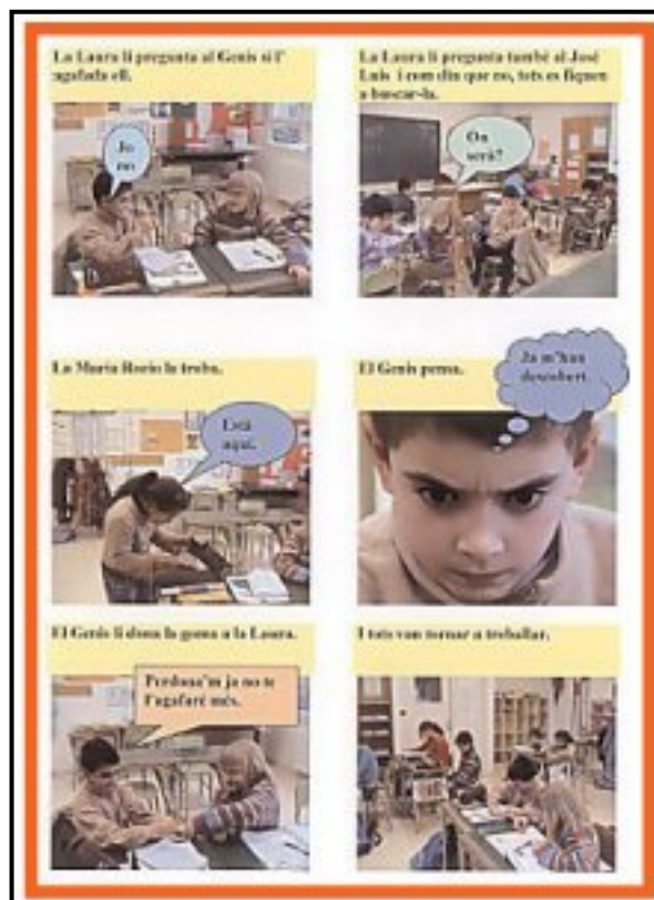
CEIP Pinyana (Alfarràs) Breus històries per conviure millor.