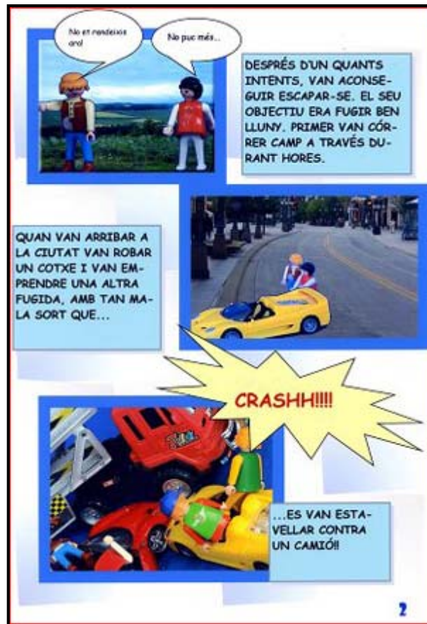
CEIP Pinyana (Alfarràs) Treball Conjunt